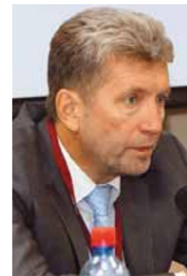
Александр Иванович ВИСЛЫЙ Генеральный директор РГБ